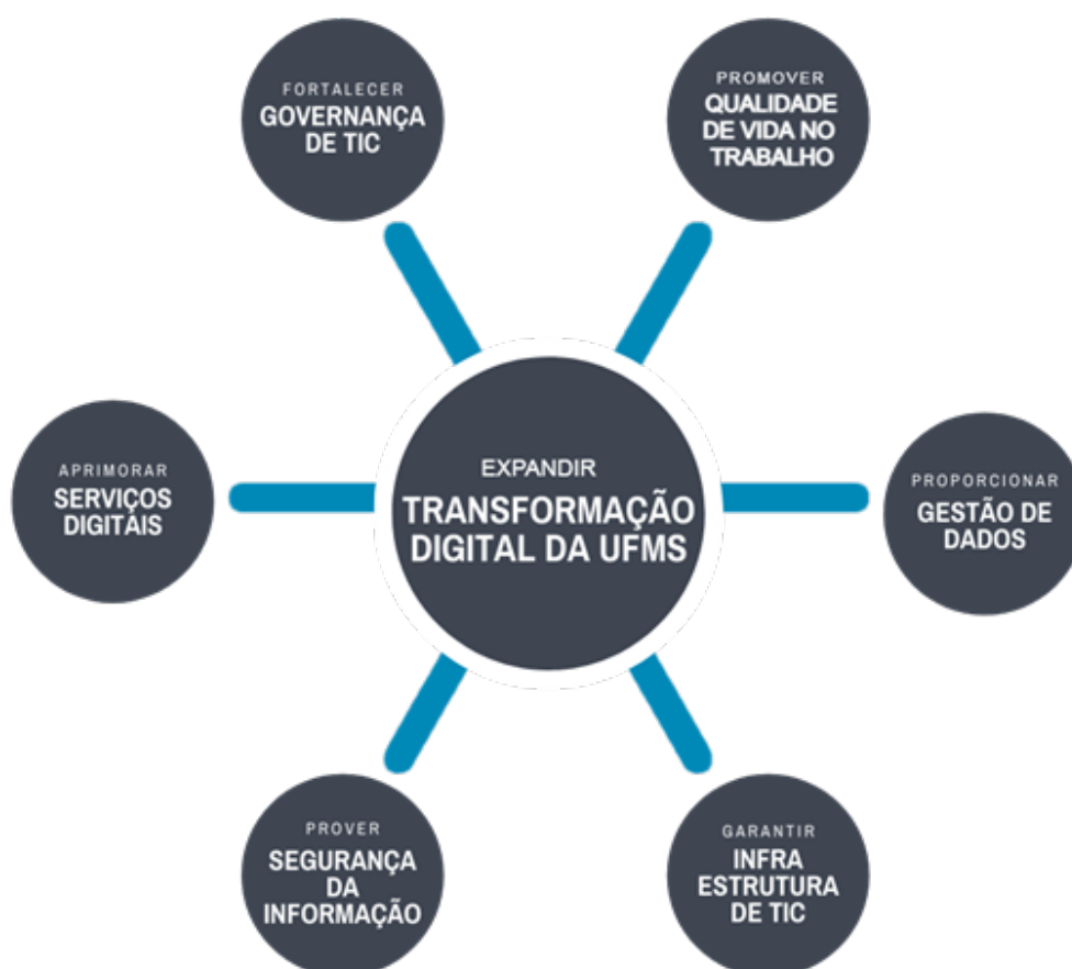
Figura 1: Eixos Estratégicos da Agetic.

Em consonância com a Visão e Missão da Instituição e da unidade, foram estabelecidos seis eixos Estratégicos de TIC, apresentados na Figura 1, na qual destaca-se o ponto central do diagrama, Expandir a Transformação Digital da UFMS, que representa a missão da Agetic e os demais eixos que o circundam serão descritos a seguir.