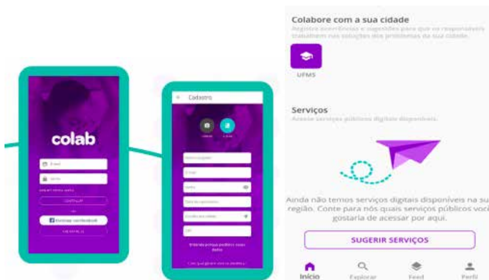
Figura 1 - App Colab

Visando maior agilidade no recebimento e atendimento das solicitações de serviços, em 2021, a UFMS passou a utilizar um aplicativo colaborativo denominado COLAB (Figura 1) onde os usuários podem realizar solicitações de serviços na Cidade Universitária e no câmpus de Três Lagoas 12 . Nos demais câmpus, as solicitações são realizadas por sistema eletrônico interno.