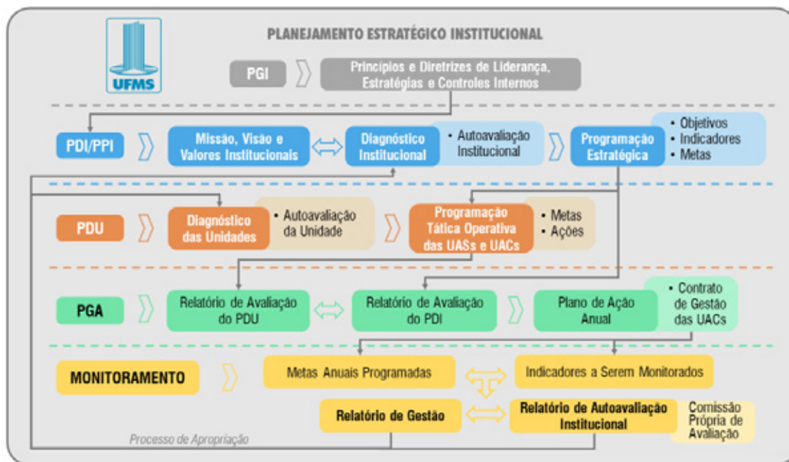
Figura 2: Planejamento Estratégico Institucional da UFMS

O Planejamento Estratégico Institucional é composto por um compêndio de artefatos norteadores, sendo representado pela Figura 2: